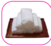
保冷剤 (2日 (1回) 分)