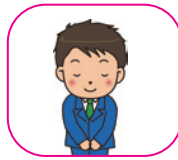
葬家専属スタッフ