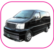
寝台車 / 出棺車両