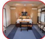
お別れ式場使用料