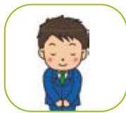
葬家専属スタッフ