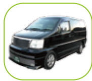
寝台車 / 出棺車両